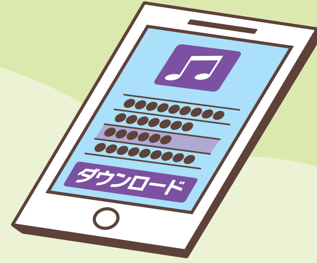
スマートフォンで 音楽をダウンロードする