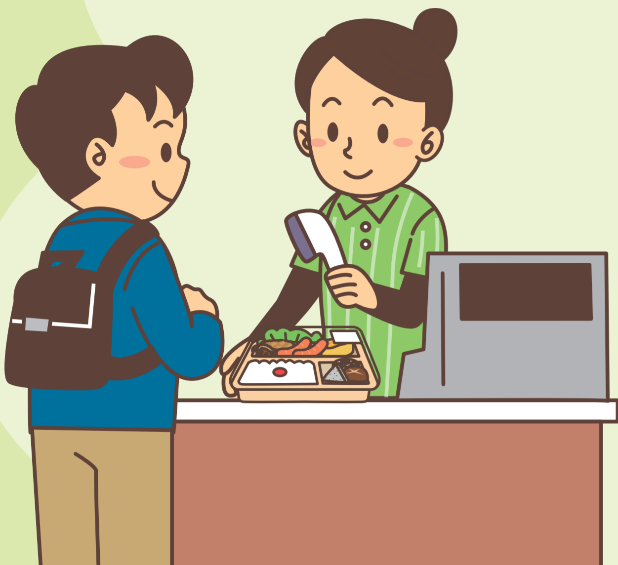
コンビニでお弁当を買う