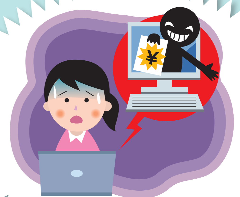
ネット詐欺などの被害

インターネットやSNSを安全に利用するためには、子供たちに“適切に利用する力”を育成することが必要です。