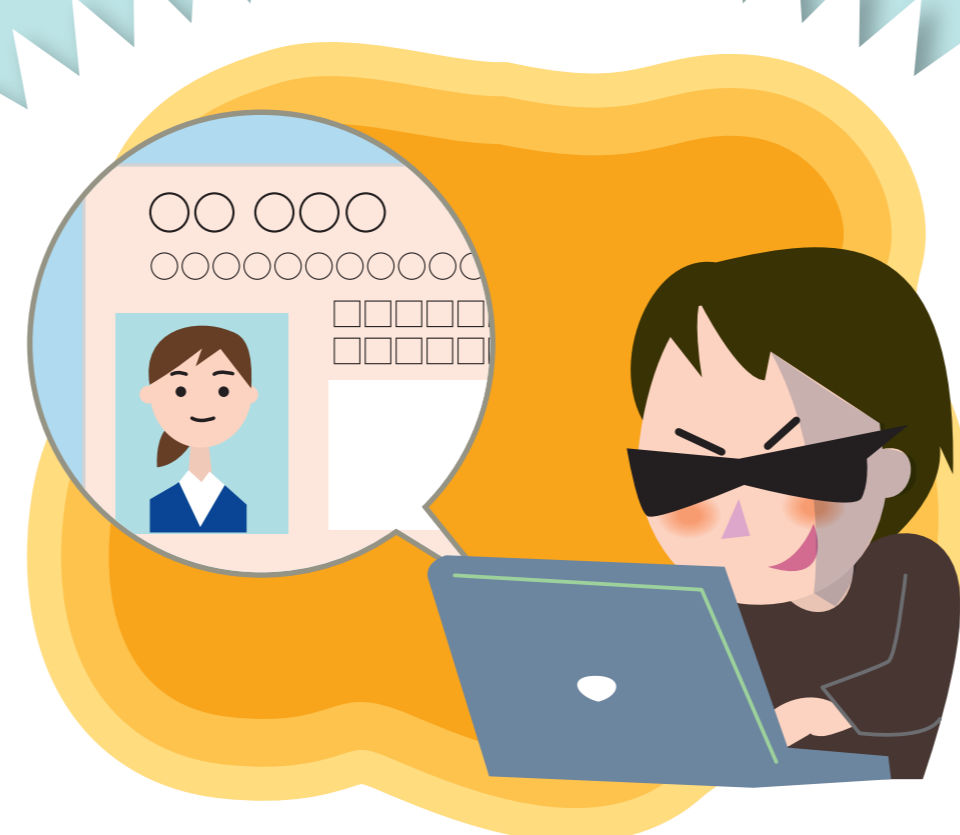
個人情報の書き込み