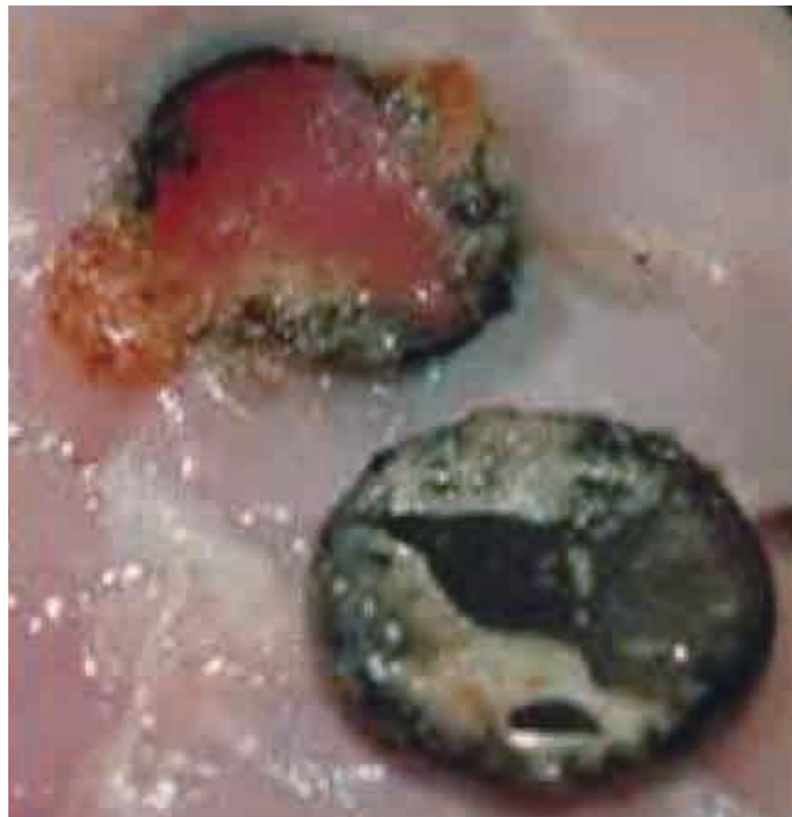
被害状況の再現(鶏肉にコイン形リチウム電池を接触させた30分後の様子)

特にコイン形リチウム電池は放電能力が高いため、短時間で消化器内で化学反応を起こします。また、直径が大きく食道に留まる可能性が高いため、誤飲すると死亡事故(※)につながる恐れがあります!