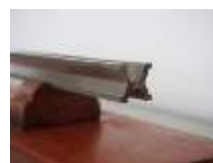
メートル原器レプリカ

開催期間 令和元年8月1日（木曜日）から8月30日（金曜日）まで （土曜日・日曜日・祝日を除く）