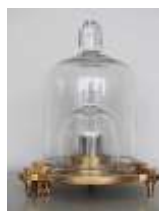
キログラム原器レプリカ

〈使用用途〉 江戸時代に小判などの金貨や丁銀などの銀貨を両替するために使用されました。