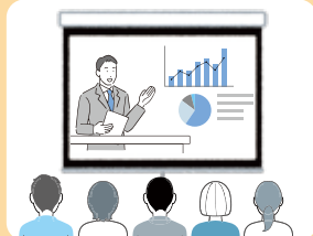
立川会場(サテライト) 30名