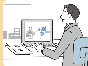
オンライン配信 220名 (Teamsによる受講)