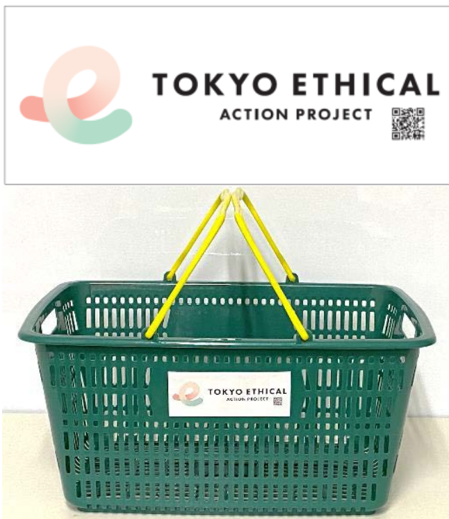
【東京都限定マイバスケット】