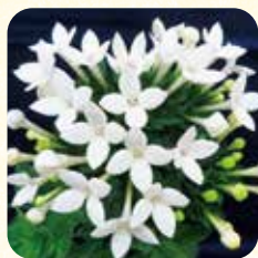
東京スター シルキーホワイト