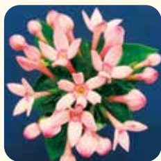
東京スター パールピンク