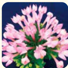
東京スター クリアピンク