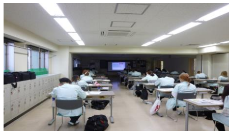
(専門学校における出前講座)