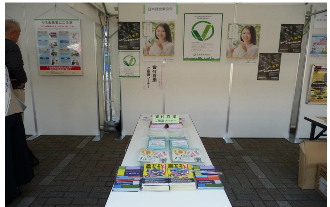
一都三県ヤミ金融被害防止合同キャンペーン

協会ホームページや季刊誌及びリーフレット等での広報を進めるとともに、関係団体等主催のキャンペーン等参加や全国の消費生活センター及びギャンブル等依存症専門機関等に対して、広く制度を周知する方策を検討する。