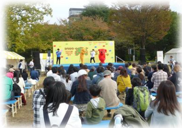
(ステージイベントの様子)