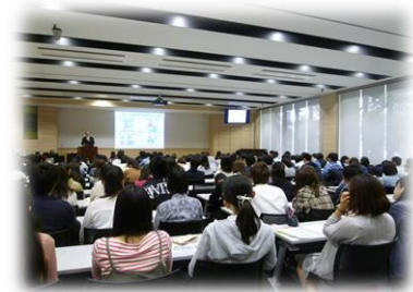
(大学における出前講座)