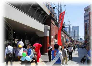
(キャンペーングッズの配布)