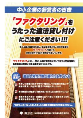
【注意喚起リーフレット】 (1)偽装ファクタリング