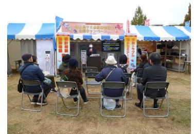
【金融トラブル防止セミナーの様子】