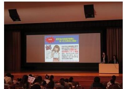
【短期大学での出前講座】