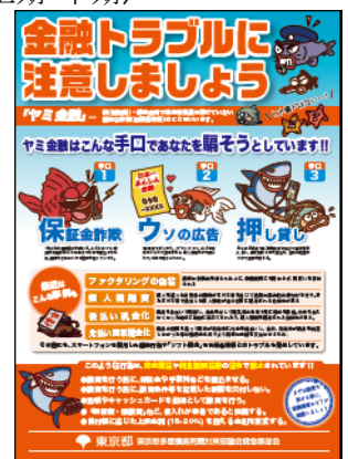
【啓発リーフレット】