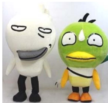
【着ぐるみイメージ】 左:サギだもん 右:カモかも