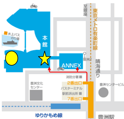
【アーバンドック ららぽーと豊洲地図】 ○映画館(3階)、☆着ぐるみ会場(1階)

8月3日(土)、4日(日)13:00～17:30 には、アーバンドック ららぽーと豊洲で啓発リーフレットやグッズを配布し、悪質商法被害防止を呼びかけます。