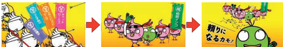
映画館での啓発 CM(イメージ)