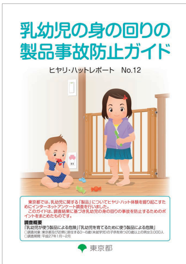
乳幼児の身の回りの製品事故防止ガイド