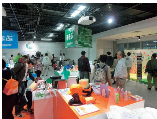
「セーフティグッズフェア」 安全な商品の展示