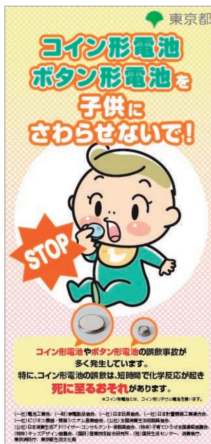
注意喚起リーフレット