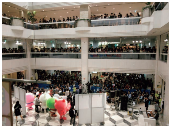
若手芸人と学生芸人が悪質商法をテーマに漫才・コントを披露(公開収録イベント)(平成 27 年度)