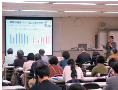
消費者問題マスター講座(平成27年度)