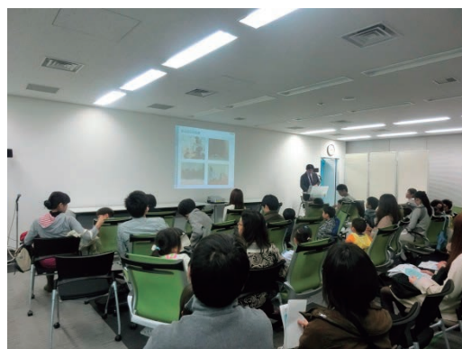
「セーフティグッズフェア」 生活安全セミナーの様子