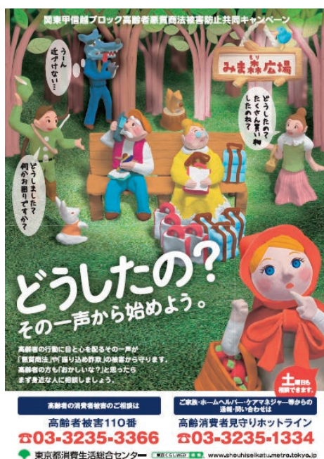
悪質商法被害防止キャンペーンポスター