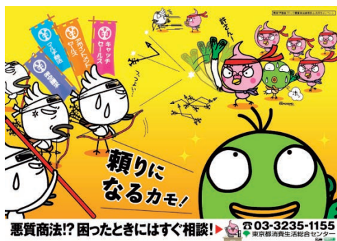
若者向け悪質商法被害防止キャンペーンポスター