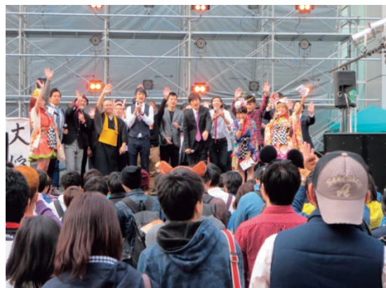
若手芸人と学生芸人による大学祭での消費者被害防止啓発(平成 27 年度)