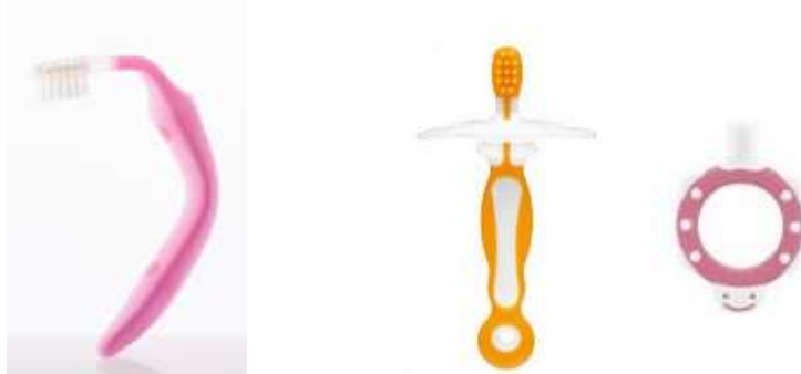
喉突き防止対策を施した子供用の歯ブラシの例

同様の事故の再発防止や商品改善につなげるため、事故時の対応結果等について情報提供しましょう。