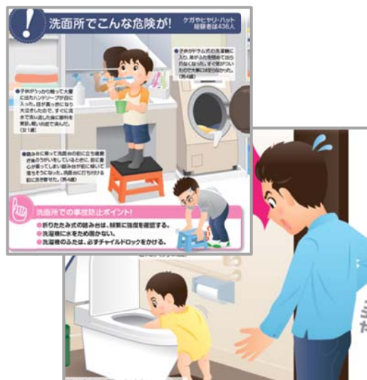
事故防止ガイド :P4 洗面所、P5 トイレ 「ヒヤリ・ハット事例」と「事故防止ポイント」