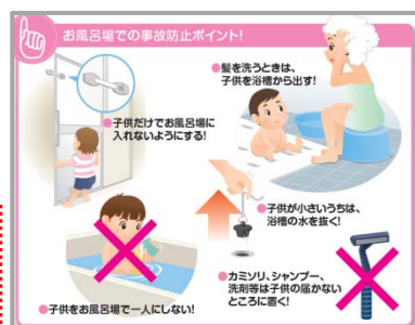
事故防止ガイド P3 「お風呂場での事故防止ポイント」