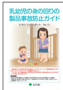
乳幼児の身の回りの製品事故防止ガイド ～ヒヤリ・ハットレポートNo.12～ (H27年度発行)